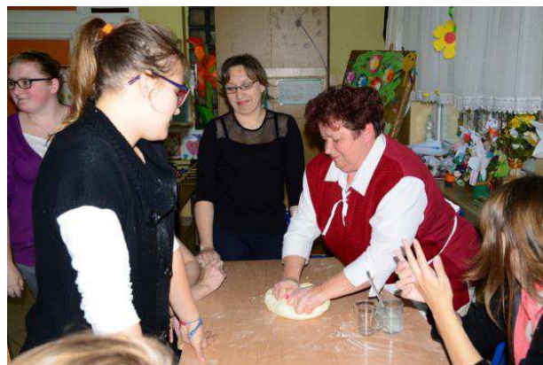
Panie ze Stowarzyszenia Kobiet „Jagienka” dzielą się swoimi umiejętnościami z uczniami ZPO w Oblęgorku i ich rodzicami.