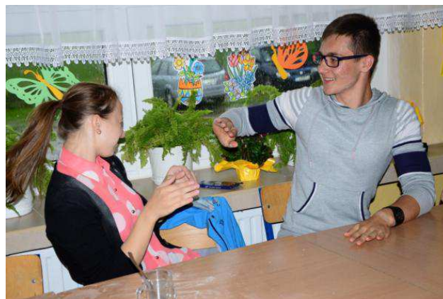
Atmosfera dobrej zabawy udzieliła się również naszym trzecioklasistom.