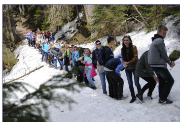
Uczniowie podczas rzuca- nia śnieżkami.