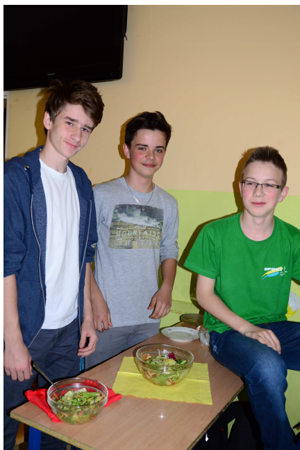
Chłopaki z Ib po zakończeniu swojej pracy.