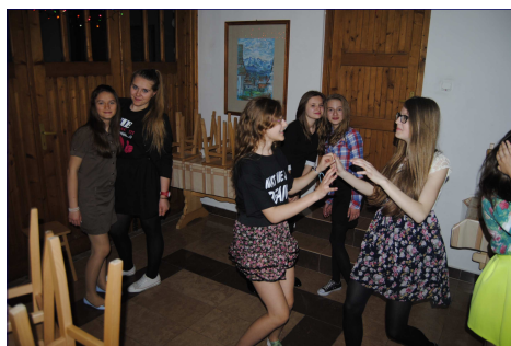
Dziewczyny bawiące się podczas dyskoteki