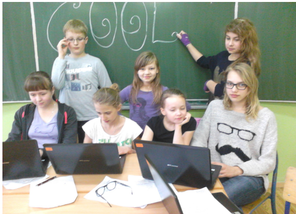
fol. Szkolne Koło Redakcyjne

Niektóre z artykułów, które napisaliśmy w trakcie naszych spotkań, zamieściliśmy w niniejszej gazetce.